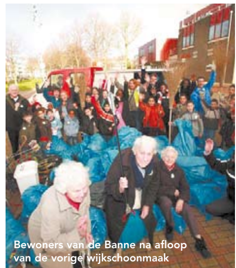
Bewoners van de Banne na afloop van de vorige wijkschoonmaak

De kosten voor de middag zijn 1 euro. Meer weten? Bel met Sportbuurtwerk, tel. 020- 63 63 867.