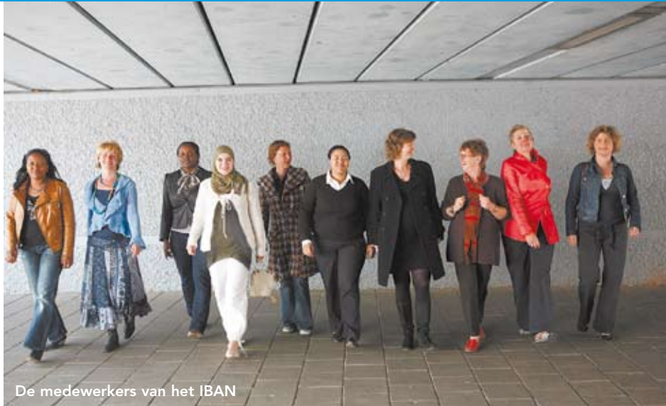
De medewerkers van het IBAN

IBAN was al actief in de Banne, de Vogelbuurt en Nieuwendam-Noord. In