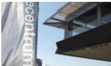
17 Bedrijfsrestaurant van Shell