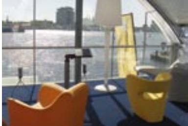
18 Informatiecentrum Overhoeks

Ook het voormalige bedrijfsrestaurant van Shell 17 , dat schuin achter het Ponthuys staat, krijgt een openbare bestemming. Arthur Staal ontwierp het rond 1970. Het dak bestaat uit platte en schuine daken die doen denken aan een verzameling grotere en kleinere tenten. Deze zijn wellicht geïnspireerd door de reizen die Staal in de jaren dertig maakte naar onder andere Noord-Afrika en Egypte.