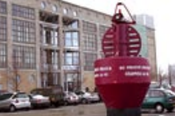
● .10 De Groene Draeck